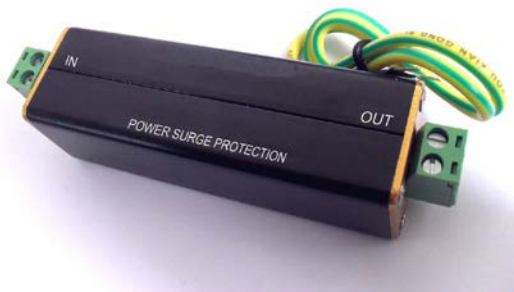
Рис.1 Внешний вид SP-DC/12, SP-DC/24, SP-DC/48