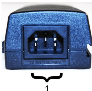
Рис.2 Инжектор Midspan-1/300GA, Midspan-1/300G, Midspan-1/600G вид сзади