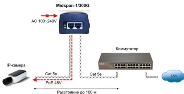
Рис. 3. Схема подключения инжектора Midspan-1/300G Инжекторы Midspan-1/300GA, Midspan-1/600G подключаются аналогично.